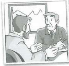
b Un compañero de trabajo a otro.