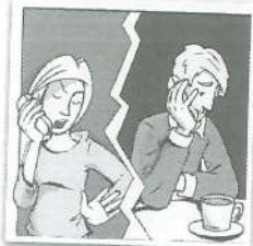
e Una chica a su ex por teléfono.