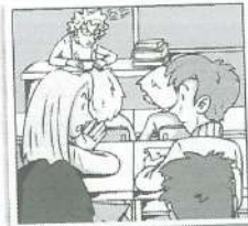
f Una compañera de clase a un compañero.

Para aclarar las cosas Ex: persona que ya no es la pareja sentimental de otra.