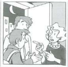
d Una madre a sus hijos.