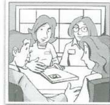
c Dos profesoras a unos padres.