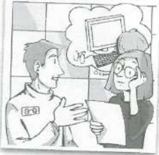
a Una oculista a un paciente.